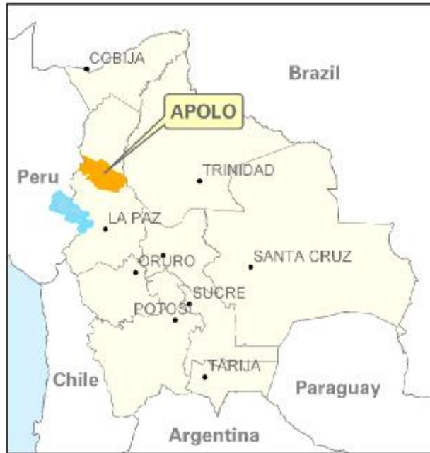
Ubicación del municipio de APOLO