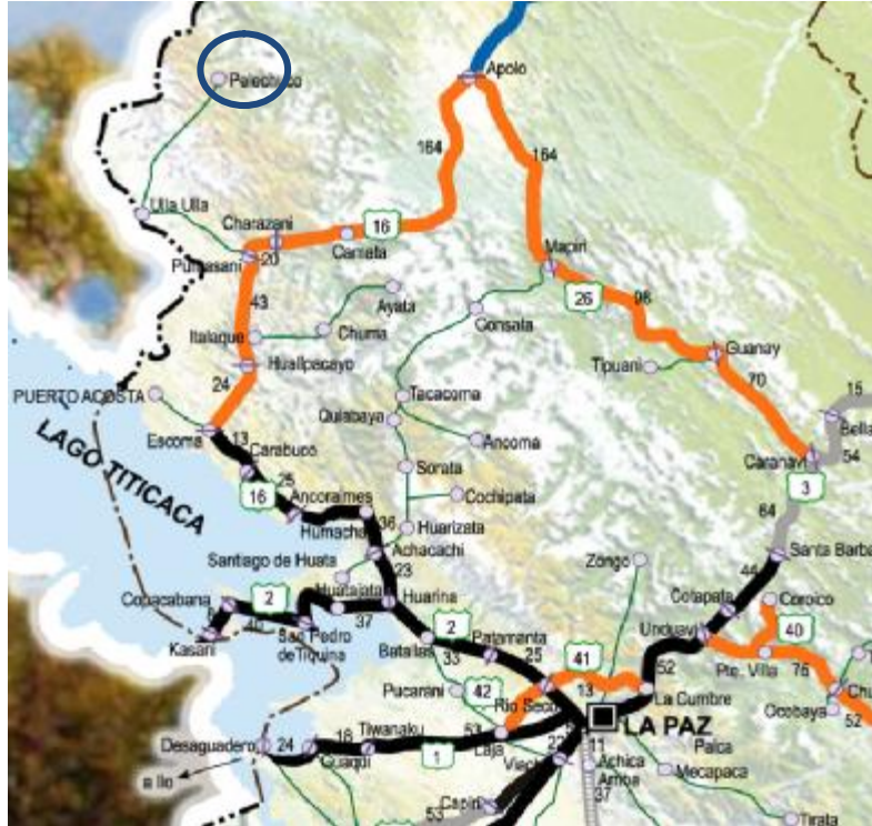
Mapa Vial: vías de acceso carretero La Paz – Apolo